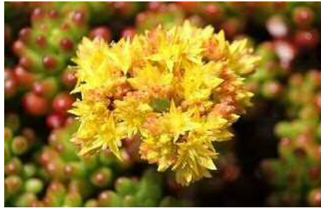
セダム・ニジノタマ