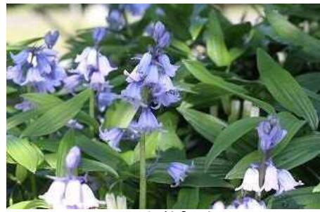
ツリガネズイセン